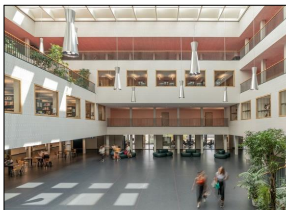
Das Gymnasium Bäumlhof ist ein öffentliches Kurzgymnasium im Kanton Basel-Stadt mit ca. 500 Schülerinnen und Schülern. Die Matura kann in vier unterschiedlichen Schulmodellen erworben werden.