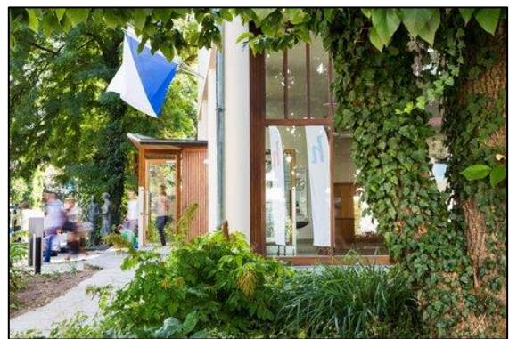
Die Kantonsschule Hottingen in Zürich ist eine öffentliche Mittelschule mit einem Wirtschaftsgymnasium, einer Handelsmittelschule sowie einer Informatikmittelschule mit insgesamt 800 Schülerinnen und Schülern.

Fokus auf den entsprechenden Akzent. Erwartet werden aber auch zusätzliche Leistungen, die durch ein besonderes Zertifikat als Beilage zum Abschlusszeugnis ausgewiesen werden. Bis heute prägen die Akzente das Profil des Gymnasiums und werden weiterhin gerne gewählt – aktuell führt die KSH pro Jahrgang eine Akzentklasse Ethik/Ökologie und zwei Akzentklassen Entrepreneurship.