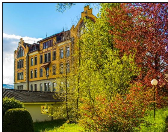
Die Kantonsschule Seetal mit Langzeitgymnasium, Kurzzeitgymnasium und Fachmittelschule ist mit 450 Schülerinnen und Schülern eine eher kleine Schule (Bildquelle: Gabriela Probst).

Darüber hinaus können die Jugendlichen wählen, wie sie die 80 Stunden (entspricht zwei Arbeitswochen) absolvieren: Der Einsatz kann am Stück bei einer Organisation durchgeführt werden oder über längere Zeit verteilt sein und auch aus unterschiedlichen Aktivitäten zusammengesetzt stattfinden. Die Erfahrung soll soziale und persönliche Kompetenzen der Schülerinnen und Schüler fördern und zur Gesellschaftsreife beitragen.