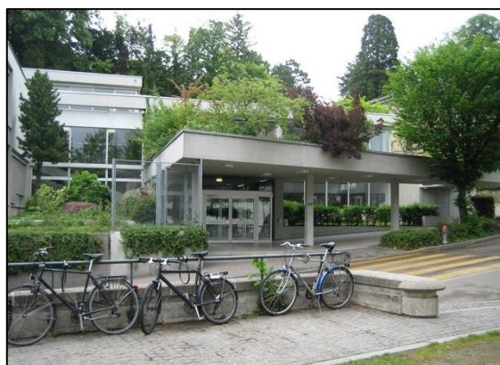
Die Kantonsschule Stadelhofen ist ein öffentliches Kurzgymnasium im Kanton Zürich mit 700 Schülerinnen und Schüler.

In der Ausgestaltung ihrer Fachwochen und in der Wahl, ob sie in Kooperation mit anderen Lehrpersonen eine Projektwoche organisieren möchten, sind die Lehrpersonen frei. Es kämen immer wieder grossartige Projekte zustande, schwärmt Tobler. Aktuell ist beispielsweise eine Projektwoche der Fachbereiche Biologie und Sport zum Thema Meeresbiologie auf der Mittelmeerinsel Elba geplant.