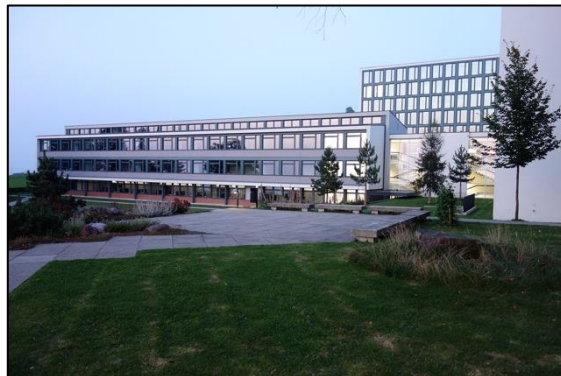
Die Kantonsschule Menzingen ist ein öffentliches Kurz- und Langgymnasium im Kanton Zug mit ca. 580 Schülerinnen und Schülern

Für jedes der beiden Integrationsfächer stehen drei Wochenstunden zur Verfügung. Mit ganz wenigen Ausnahmen werden sie von allen Lehrpersonen der beteiligten Fachschaften unterrichtet: Beim IF Naturwissenschaften sind das die Fachbereiche Biologie, Chemie und Physik und beim IF Geistes- und Sozialwissenschaften Geografie, Geschichte sowie Wirtschaft und Recht. Die Planung, Vorbereitung und auch die Durchführung des IF-Unterrichts findet in enger Teamarbeit statt. Auch die Mitarbeit der Schülerinnen und Schüler wird gefordert. Da es ein Anliegen ist, die Interessen der Jugendlichen aufzunehmen, werden sie in die Themenfindungsprozesse eingebunden.