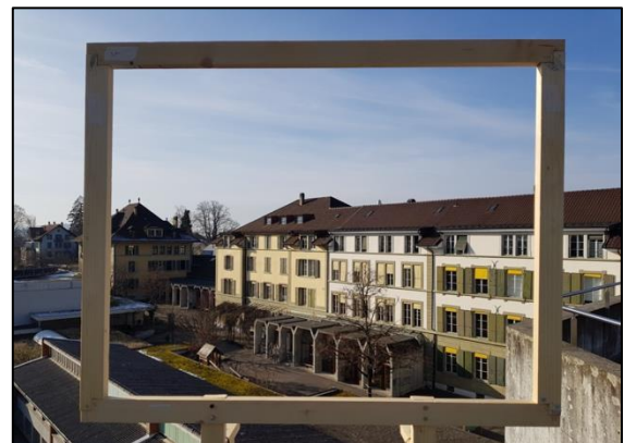
Das Gymnasium Muristalden ist eine private teilsubventionierte Schule mit anerkannter Matura im Kanton Bern. Die Gymnasialabteilung ist Teil des Campus Muristalden und umfasst rund 250 Schülerinnen und Schüler.