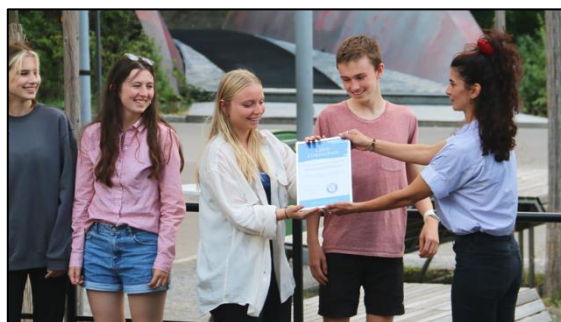
Zertifikatsübergabe durch MYBLUEPLANET

Kriterien erfüllt werden, darunter die Integration von Klima- und Nachhaltigkeitsthemen im Leitbild der Schule und im fächerübergreifenden Unterricht, die Gründung eines Klimarats sowie die Reduktion des Energieverbrauchs an der Schule. Durch die, wie Bietenhader findet, bereichernde Zusammenarbeit mit MYBLUEPLANET konnten die Voraussetzungen erreicht werden und die Kantonsschule Büelrain wurde 2021 als erstes Gymnasium der Schweiz zur Klimaschule ernannt.