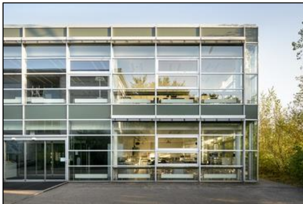
Die Kantonsschule Solothurn ist mit ihrem breiten Lehrangebot (Sekundarschule P, Gymnasium, Fachmittelschule und Passerellen-Lehrgang) und insgesamt 1900 Schülerinnen und Schülern eine der grössten Mittelschulen der Schweiz.