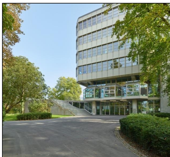
Das Gymnasium Münchenstein ist eine öffentliche Mittelschule im Kanton Basel-Landschaft mit einer Maturitätsabteilung und einer Fachmittelschule. Das Kurzgymnasium wird von ca. 700 Schülerinnen und Schülern besucht.