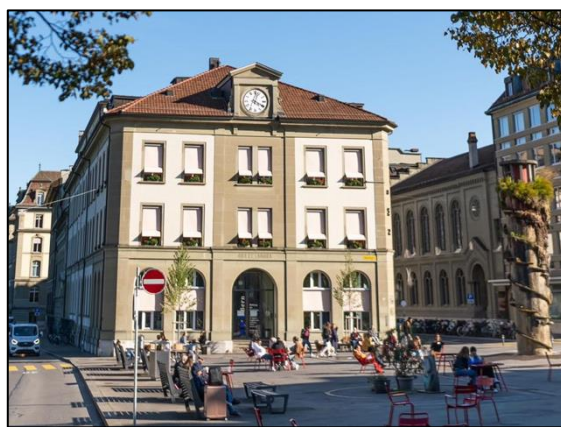
Die NMS ist eine private Gesamtschule im Zentrum der Stadt Bern mit einem breiten Bildungsangebot von der Volksschule übers Gymnasium und eine Fachmittelschule bis zum Pädagogischen Hochschulinstitut. Zirka 220 Schülerinnen und Schüler besuchen das Gymnasium an der NMS.

Gegenwärtig liegt der Fokus auf der «normativen» und insbesondere auf der «angewandten» Ethik mit den beiden Bezugswissenschaften Philosophie und Theologie (heutige Bezeichnung: fächerintegrierter Ethikunterricht). Zu verschiedenen Zeitpunkten des gymnasialen Unterrichts werden fünf Fächer durch diese Perspektive und durch Teamteaching bereichert (siehe Tabelle).