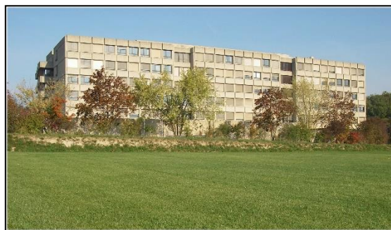
Das Collège de Saussure ist eines von 11 öffentlichen Gymnasien im Kanton Genf und wird von rund 1000 Schülerinnen und Schülern im Alter von 15 bis 19 Jahren besucht.