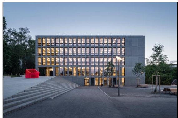
Die Kantonsschule Büelrain in Winterthur ist eine öffentliche Mittelschule mit einem Wirtschaftsgymnasium, einer Handelsmittelschule sowie einer Informatikmittelschule mit insgesamt 700 Schülerinnen und Schülern.