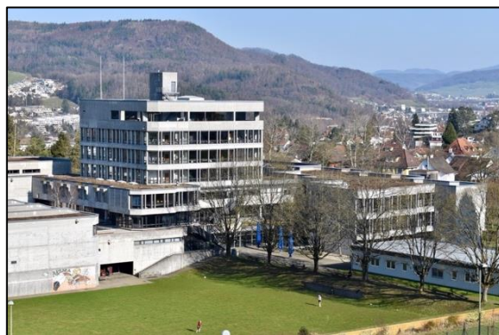
Mit etwa 900 Schülerinnen und Schülern (in der Gymnasialabteilung) ist das Gymnasium Liestal das grösste der fünf öffentlichen Gymnasien im Kanton Basel-Landschaft.

Das Ergebnis? Schülerinnen und Schüler wählen Themen, die sie interessieren und lernen von Lehrpersonen, die sich für das Thema begeistern.