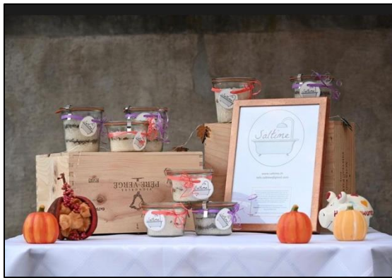
Pool Wirtschaft: Eine Gruppe präsentiert ihre Ergebnisse.

Die sichtbaren Ergebnisse der einzelnen Projekte werden traditionsgemäß nach Abschluss der Pooljahre in der Aula präsentiert. Dies kann eine Herausforderung sein. Eine gewöhnliche Matheprüfung müssen die Schülerinnen und Schüler ja nicht in der Öffentlichkeit zeigen, aber bei den Pool-Projekten müssen sie zu ihren Ergebnissen stehen und diese vorstellen.