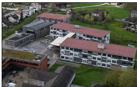
Die Kantonsschule Uetikon am See ist ein öffentliches Kurz- und Langgymnasium im Kanton Zürich, das sich im Aufbau befindet, mit aktuell 600 Schülerinnen und Schülern.

So hat sich an der KUE in den vergangenen fünf Jahren auch vieles bereits wieder verändert und einiges wurde weiterentwickelt. Als Beispiel hierfür wird im Folgenden die Entwicklung eines pädagogischen Ansatzes an der KUE beschrieben.