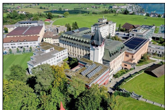
Das Gymnasium Immensee ist eine staatlich subventionierte, als Tagesschule organisierte Mittelschule in privater Trägerschaft mit einem Lang- und Kurzgymnasium sowie einem Internat, das von etwa 30 der insgesamt rund 350 Schülerinnen und Schülern genutzt wird.

Die Lernbüros bieten eine ideale Gelegenheit für selbstorganisiertes Lernen, weshalb das Gymnasium Immensee bereits früh ein SOL-Konzept umsetzte. Obwohl sie im Vergleich mit anderen Schulen früh mit SOL-Formen begonnen hätten, gebe es mittlerweile verschiedene Schulen, deren SOL-Konzepte viel weiterentwickelter seien, bedauert Planzer. «Das soll sich in Zukunft wieder ändern», erklärt er weiter und berichtet, dass in diesem Bereich Entwicklungsschritte geplant sind.