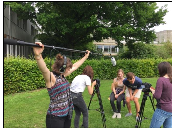
Pool Kunst: Schülerinnen und Schüler bei der Arbeit an ihrem Projekt

gleichzeitig anwesend, sie betreuen aber gemeinsam die Projekte der Jugendlichen, gestalten im Teamteaching eine Einführung, gehen mit mehreren Gruppen auf eine Exkursion und sind auch gemeinsam für die Bewertung der Projektergebnisse zuständig. Die Noten der Pools werden im Zeugnis nicht separat nachgewiesen, sondern ins Schwerpunktfach eingerechnet.