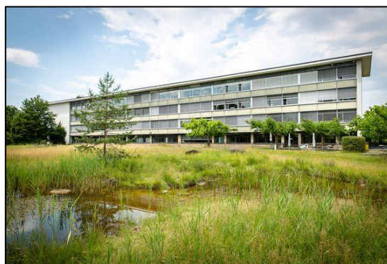
Die Kantonsschule Zürcher Oberland in Wetzikon ist ein öffentliches Kurz- und Langgymnasium im Kanton Zürich mit 1300 Schülerinnen und Schülern.

schlimm!». Entscheidend sei aber, dass eine Reflexion darüber stattfindet und dass die Jugendlichen daraus lernen.